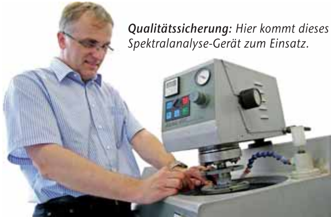
Qualitätssicherung: Hier kommt dieses Spektralanalyse-Gerät zum Einsatz.