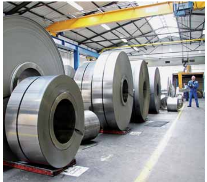
Alles im Blick: Sowohl das Vormaterial als auch das fertige Edelstahlband wird an zentraler Stelle zwischengelagert.