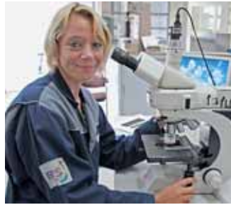
Werkstoffprüfung: Da braucht man ein geschultes Auge.